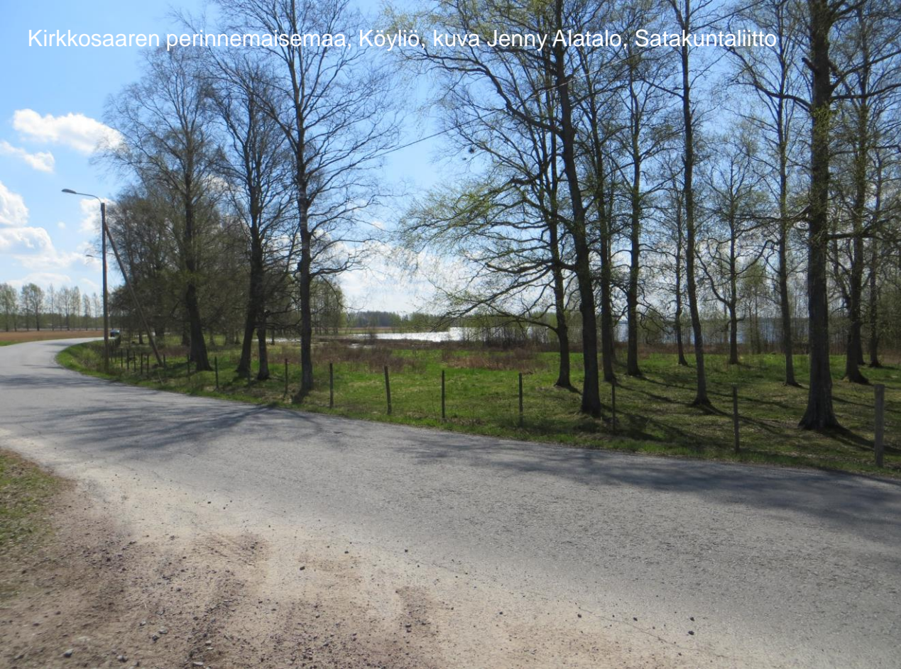
Kirkkosaaren perinnemaisemaa, Köyliö