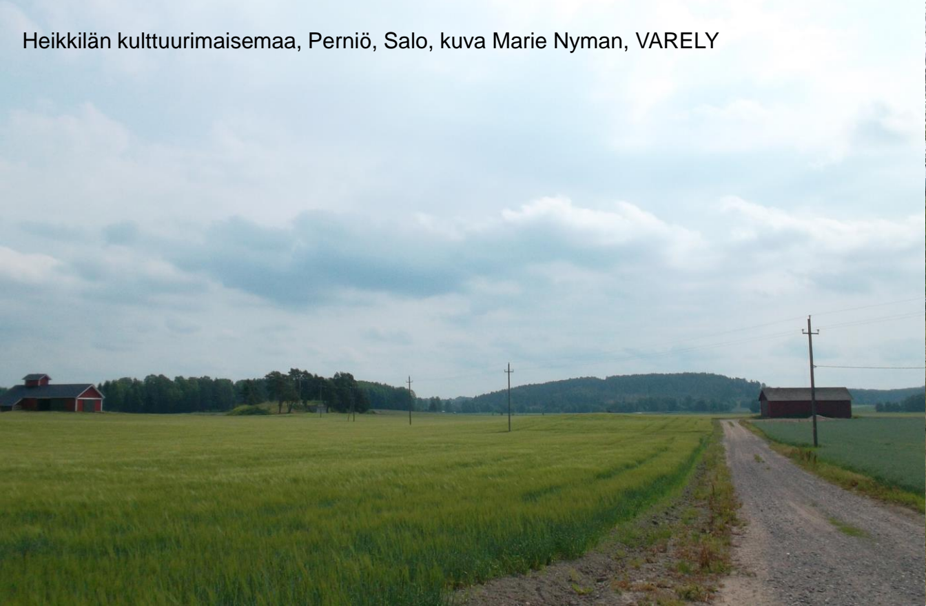
Heikkilän kulttuurimaisemaa, Perniö, Salo