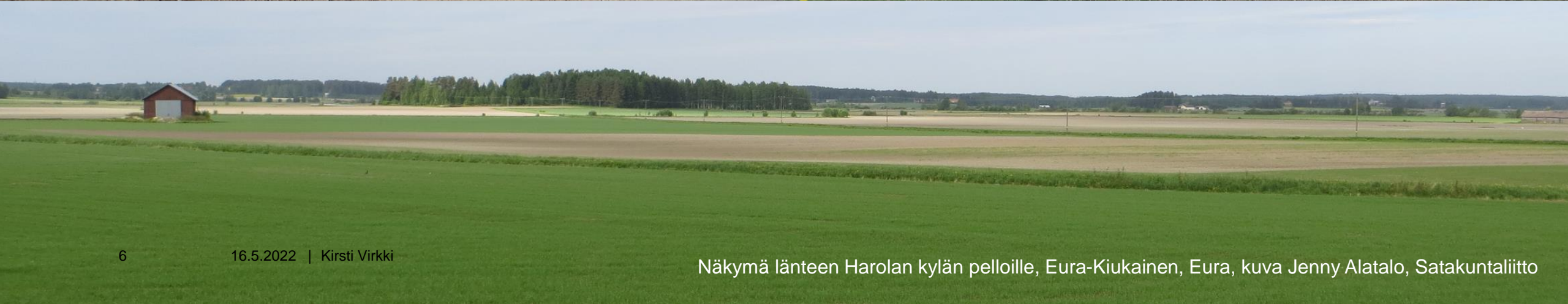
Näkymä länteen Harolan kylän pelloille, Eura-Kiukainen, Eura