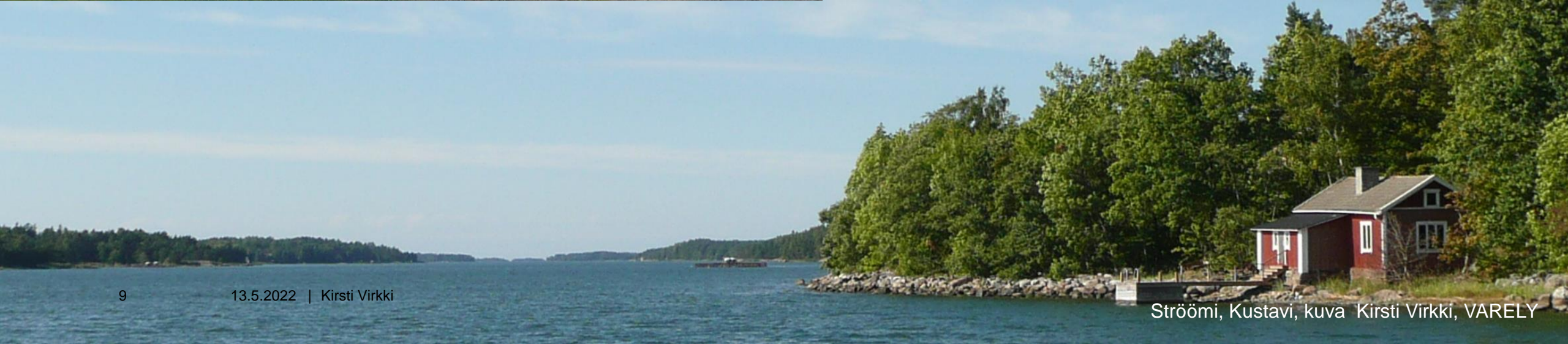
Strööm, Kustavi, kuva Kirsti Virkki, VARELY